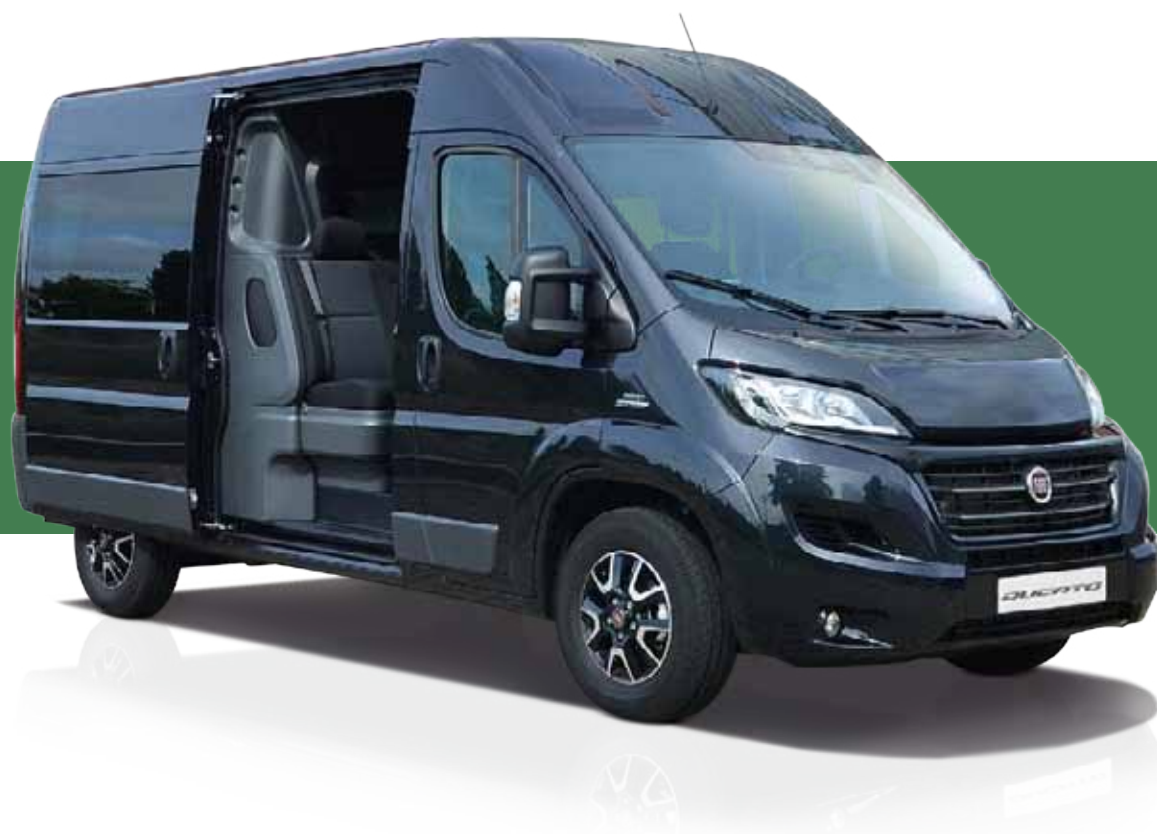
Fiat Ducato Kastenwagen Doppelkabine (Multicab) L2H2, L4H2, L5H2