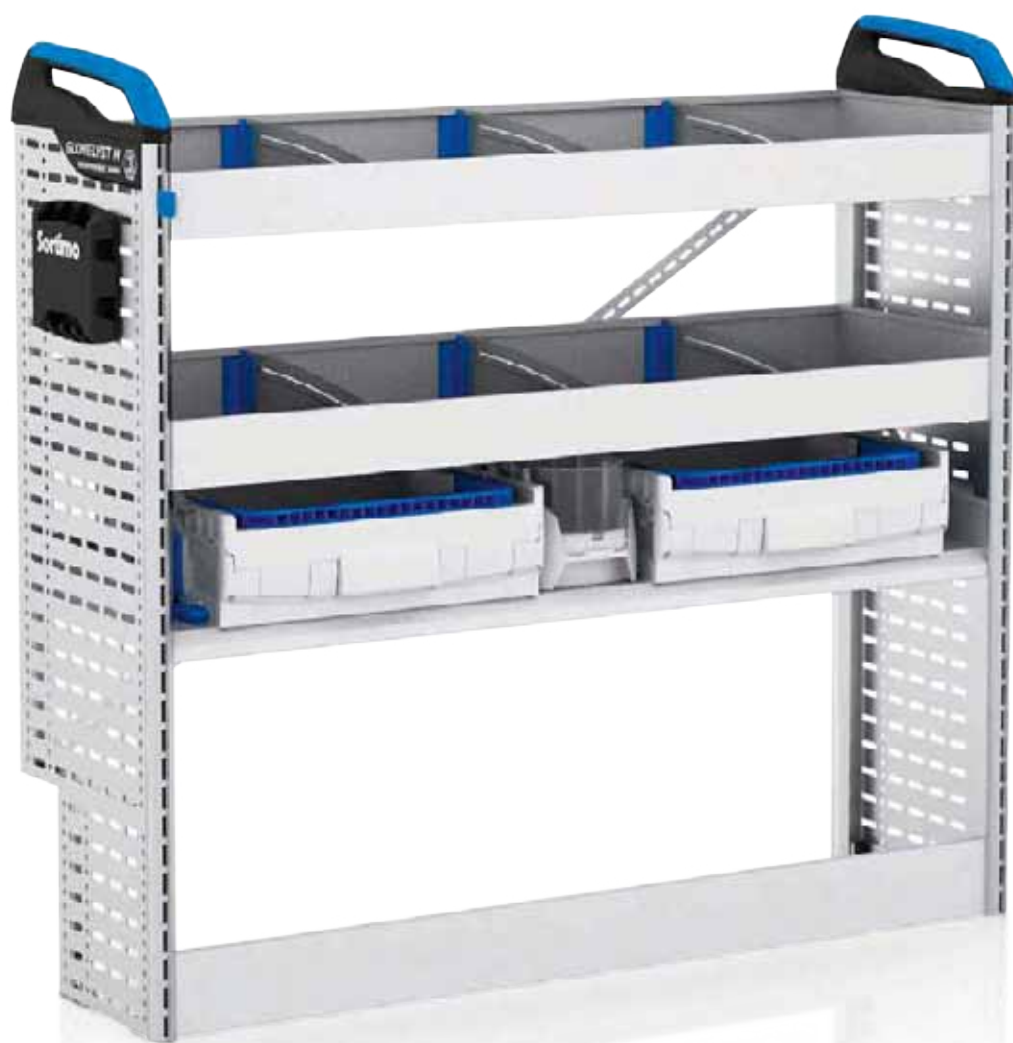
Beispiel: Werkstatteinrichtung (Laderaum linke Seite), Fiat Doblo Cargo