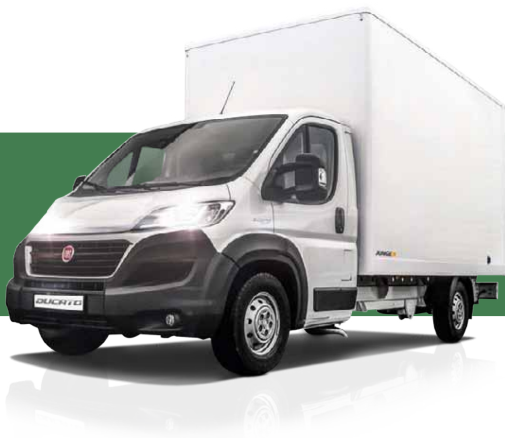
Fiat Ducato Kastenwagen L5