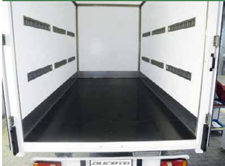
Laderaum mit Stäbchenzurrschienen