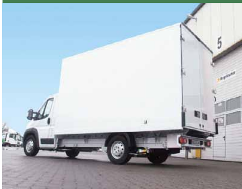
Seiten- und Heckansicht Leichtbaukoffer